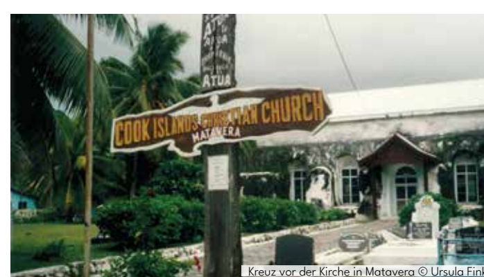
Kreuz vor der Kirche in Matavera

Anmeldung: Frau Schreiber, Tel.: 02744 209 Mail: herdorf-struthuetten@ekir.de